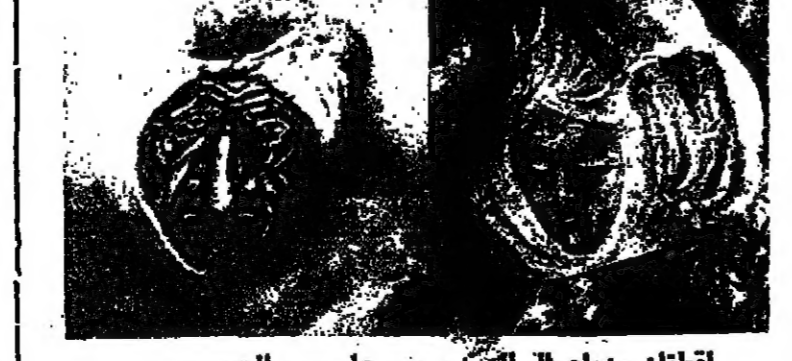
لقطاف من أعمال الرسام عيسى الحصى